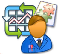
ฝ่ายวางแผนการผลิต