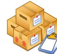
ฝ่ายสินค้าคงคลัง