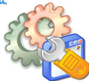
ฝ่ายผลิต