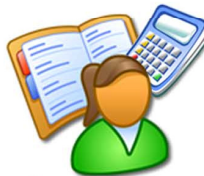
ฝ่ายบัญชีต้นทุน